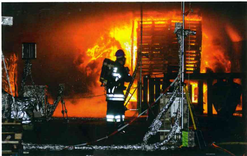
Validationsversuche für einen Tunnelbrand mit aufwendiger Messtechnik

Im Rahmen des vom Bundesministerium für Bildung und Forschung geförderten Verbundvorhabens „SUVEREN“ (FKZ: 13N14393, 2017 bis 2020) werden diese NET-Fahrzeuge und die damit einhergehenden Risiken in städtischen, unterirdischen Verkehrsanlagen unter die Lupe genommen.